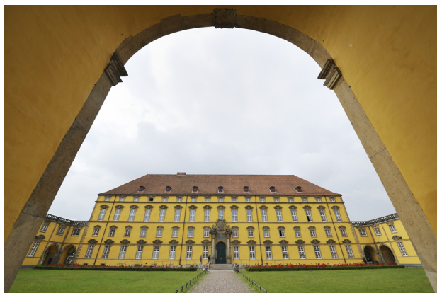
Castello dell'Università di Osnabrück Istituto di Musicologia e di Pedagogia della Musica

Erasmus partner: Università di Osnabrück