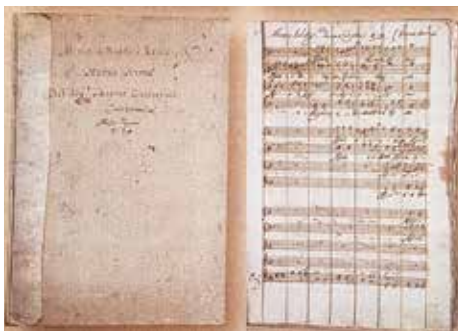
Carissimi Missa l'Homme Armé "à Doddici Reali" Archivio Musicale Lateranense

Le esecuzioni del 2017 al Festival Internazionale di Musica Sacra di Pordenone, del 2020 a Roma a S. Maria dell'Anima in collaborazione con la IUC e oggi a Marino - rientrano nel grande progetto "La via dell'Anima" che, attraverso la rete creata dalla circolazione dei tesori musicali della Santini Sammlung di Münster, unisce molte Città, fra le quali Münster e Osnabrück dove nel 1648 fu firmata la Pace di Westfalia che sanciva la fine della Guerra dei trent'anni e apriva l'Europa a nuovissimi scenari politici e religiosi.