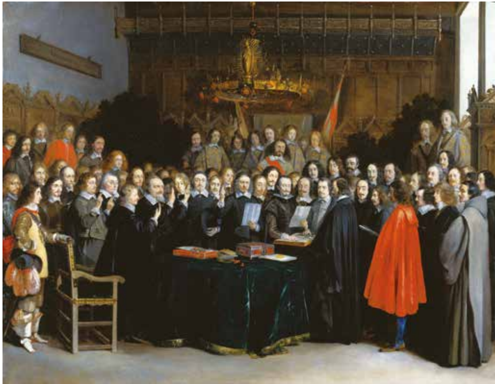
Gerard Terborch [1617-1681] - Westfälischer Friede in Münster, 1648 [Rijksmuseum - Amsterdam]