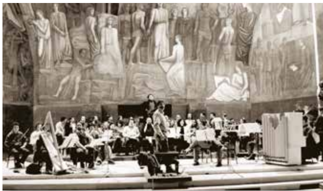
Ensemble Seicentonovecento, Oratorio Dives Malus , IUC 1996